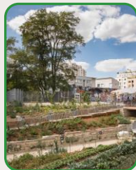
LA FERME DU RAIL

Compostage de territoire avec un modèle de collecte et de micro-plateforme en silo vertical