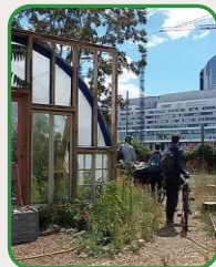
VIVE LES GROUES – ETAPE DÉJEUNER

Le projet en économie circulaire au service des citoyens de la ville d'Achères, porté par l'association ELLSA.